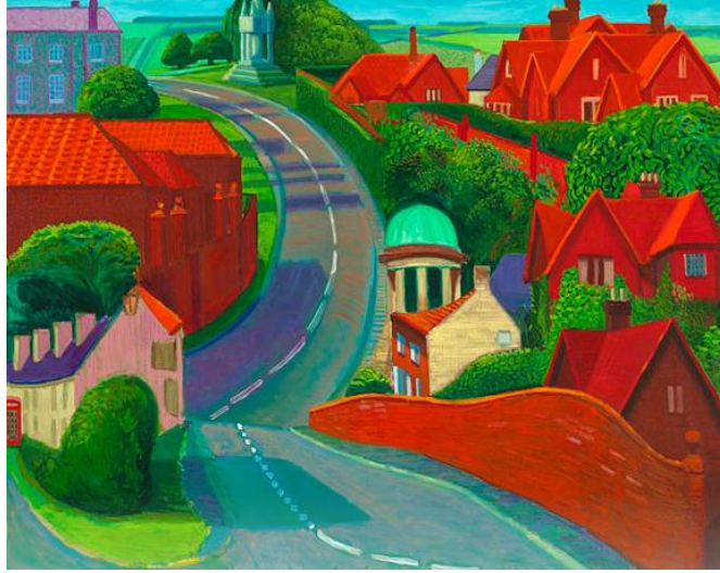
Resim 4. David Hockney, Sledmere'den York'a Giden Yol , Tuval Üzerine Yağlıboya, 1997, 121,92 x 152,4 cm.

Sanatçının kendi ifadesinden anlaşıldığı üzere; gördüğü ve izlediği olayları bir dönüşüm içerisinde aktarmıştır. Dolayısıyla görüntünün nesnel kimliğini kendi ifadesine göre değiştirerek kavramsal bir yaklaşım geliştirmiştir. Eserlerindeki nesnelere renklerini, biçimlerini ve kimliklerini bilinçli olarak değişikliğe uğrattığı söylenebilir. Bu yüzden onun resimlerdeki görüntüler ile doğanın görüntüleri farklıdır.