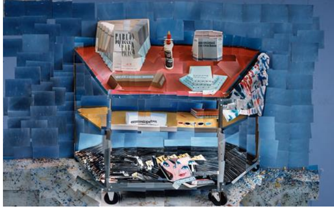
Resim 2. David Hockney, Boya Arabası , Fotoğrafik kolaj, 1985, 104,14x154,94 cm.

David Hockney'in Boya Arabası isimli eseri gündelik nesnelere konu almıştır. Bir ressamın resim yaparken kullandığı boya arabası, Hockney için sanat nesnesine dönüşmüştür. Popüler kültür ve gündelik nesnelere arasındaki bu durum; sanat nesnesi ile açıklanabilir. Diğer bir ifadeyle; nesne ve sanat nesnesi farklı kavramları işaret eder. Eserdeki nesne boya arabasıdır. Ancak esere yansıyan nesne; artık bir sanat nesnesine dönüşmüştür. Sanatçı nesneye karşı fikirselle ve kavramsal bir bağlam yansıtmıştır. Kompozisyondaki soyutlamalar ve biçimsel deformasyonlar, sanatçının dönüşüme uğrattığı başlıca özelliklerdir. Bu yüzden gündelik nesnelere ister endüstriyel bir ürün ister doğal objeler olsun, sanatçının eserine yansıdığı andan itibaren farklı bir kimliğe düşünebilmektedir.