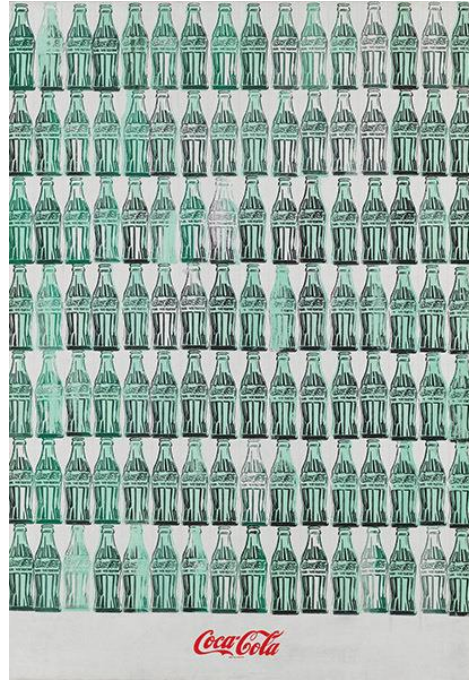
Resim 1. Andy Warhol, Yeşil Coca Cola Şişeleri , Tuval üzerine akrilik, screenprint ve graphite kalem, 1962, 210.2 × 145.1 cm.

Böylece Warhol eserlerinde; hem ünlülere hem de popüler kültür imgelerine (günlük nesnelere üzerinden) neden yer verdiği anlaşılmıştır.