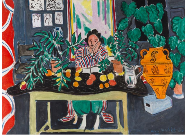
Resim 5. Henri Matisse, Etrüsk Vazolu İç Mekan , 1940, Tuval Üzerine Yağlıboya, 73.5 x 108 cm.

Matisse'in eserlerinde dikkat çeken yönü; gündelik nesnelere kendi bağlamından çıkararak yapay renk alanları yaratmasıdır. Öyle ki çoğu zaman nesnelere soyut bir biçimlere dönüşerek kendi kimliklerini yitirirler. Bu bakımdan Fovist bir ressam olarak Matisse; perspektifi renk katmanlarıyla yok ederek sanatında yeni bir yaklaşım geliştirmiştir.