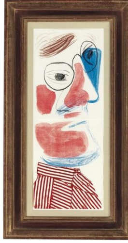
Resim 3. David Hockney, Otoportre , Kağıt üzerine baskı, 1986, 55.6 × 21 cm.

Hockney'in Otoportre isimli yapıtı bu duruma örnek olarak gösterilebilir. Bu eserinde kübist form, renk ve biçim ilişkisini Picasso'nun eserlerinden referans aldığı söylenebilir. Ancak kübist form ve biçim ilişkisini popüler kültürün imgeleriyle harmanlayarak sanatta yenilik getirmiştir. "Haziran 1986, Otoportre 'sinde diklemesine yerleştirilmiş iki kağıda, sanki yirminci yüzyılın başlarındaki modernizmin David Hockney'nin kendisi olmak için en özgür ve kolay yol değilmişçesine izlenimini uyandırarak, kendi yüzünü tıktırıyor" ( https://www.villagevoice.com/2021/03/16/decades-of-drawing-reveal-a-quieter-david-hockney/ ). Görüldüğü üzere eserdeki deformasyonlar ve soyutlama eğilimi kübistlere oldukça yakındır. Bu sebeple sanatçının 1990'lı yıllardan itibaren yaptığı eserlerinde; hem Kübizmin hem de Pop sanatının birlikteliğinden ortaya çıkan melez bir yönelim çok daha baskındır. Ayrıca araştırma kapsamında; Hollandalı ressam Rembrandt'ın eserlerindeki tekniklerden etkilendiği ortaya çıkmaktadır.