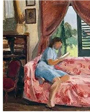
Resim 7. Şeref Akdik, Kitap Okuyan Hanım, 1950, Mukavva Üzerine Yağlıboya, 28x35 cm., ("Sanal", 2020: 1).

Son olarak, Akdik'in 'Kanepede Oturan Kız' isimli (Resim 7) çalışmasına bakıldığında da okuyan kadın figürünün arkasında görülen çalışma masası ve kitaplar kadının entelektüel imajını desteklemekte ve bu bağlamda Cumhuriyet'in yeni ideal kadın tipini vurgulamaktadır. Eserde pembe desenli bir örtünün kapladığı kanepede oturan kadının arkasındaki aydınlık büyük pencere ve duvardaki tablo ile kompozisyon tamamlanmıştır. Ayrıca söz konusu eserde, sanatçı tarafından kadının, bir yuva olarak evin koruyuculuğu altında kaygısızca geçirdiği mutlu zamanlara gönderme yapıldığı da söylenebilir. Akdik'in erken Cumhuriyet döneminde eğitim ve imaj bağlamında kadının toplumsal değişim ve dönüşümünü ortaya koyduğu okuyan kadınları burada incelenmek üzere ele alınanlarla sınırlı değildir. Ancak hem tekrara düşmemek hem de konu sınırlığı nedeni ile sanatçının bu konudaki eserlerinin hepsine yer vermek mümkün olmamıştır.