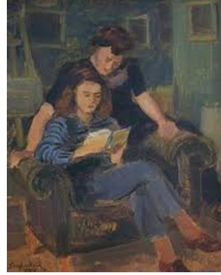
Resim 3. Şeref Akdik, Kitap Okuyanlar, 1946, Mukavva Üzerine Yağlıboya, 35x27 cm., MSGSÜ-İRHM., (Yaman 2006: 76).

Sanatçının 'Kitap Okuyan Kadın' isimli (Resim 4) çalışmasına bakıldığında ise kolsuz ve gerdanı hafif açık mavi renk tonlarında bluzu ve üzerinde kırmızı, beyaz ve sarı renk tonlarında çiçek desenleri bulunan lacivert renkli eteği ile masa üzerine koyduğu kitabı okuyan kadın figürü görülmektedir. Sanatçının önceki resimlerinde de görüldüğü gibi bu resimde de kadının bacaklarının üst üste atılmış biçimde betimlenmesi ve kompozisyonun arka planındaki sehpa üzerindeki vazo içerisinde görülen çiçekler, Cumhuriyet'in dönüşen ve değişen yeni kadın imajının ortaya konulmasında simge olarak kullanılan kitap'ın izleyici üzerindeki tesirini güçlendirmektedir.