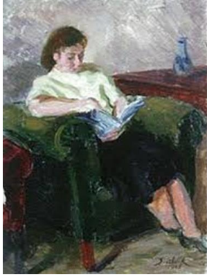
Resim 2. Şeref Akdik, Kitap Okuyan Kadın, 1945, Karton Üzerine Yağlıboya, 24,5x19 cm., MSGSÜ-İRHM., (Yaman 2006: 76).

oturuyor, kadının ayakta olduğu sahnelere uzak bir betimlemedir. Bu nedenle Akdik'in bu eseri, Cumhuriyetle birlikte ön plana alınan kadının, eğitilmiş, modern, entelektüel bakış açısına sahip, yeni nesli yetiştiren ana ve erkeğine uygun iyi bir hayat arkadaşı olarak ailenin merkezine yerleştirilme ideallerini ortaya koyarken aynı zamanda erkeğinde kadınının arkasında durduğunu, yaptığı her işte onu desteklediğini ve onayladığını göstermektedir. Sanatçının söz konusu eseri erken Cumhuriyet döneminin değişen ve dönüşen kadın modelini yansıtması yanında değişen aile yapısını da ortaya koymaktadır. Ayrıca kompozisyonda figürlerin arka tarafında görülen şövale ve duvarlarda asılı tablolardan mekanın bir atölye ortamı olduğu izlenimi doğmaktadır.