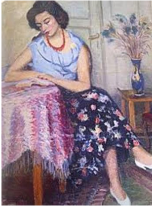
Resim 4. Şeref Akdik, Kitap Okuyan Kadın, 1951, Tuval Üzerine Yağlıboya, 61x50 cm., İzmir Devlet Resim Heykel Müzesi, (Yaman 2006: 111).

Sanatçının 'Kitap Okuyan Kadın' isimli (Resim 4) çalışmasına bakıldığında ise kolsuz ve gerdanı hafif açık mavi renk tonlarında bluzu ve üzerinde kırmızı, beyaz ve sarı renk tonlarında çiçek desenleri bulunan lacivert renkli eteği ile masa üzerine koyduğu kitabı okuyan kadın figürü görülmektedir. Sanatçının önceki resimlerinde de görüldüğü gibi bu resimde de kadının bacaklarının üst üste atılmış biçimde betimlenmesi ve kompozisyonun arka planındaki sehpa üzerindeki vazo içerisinde görülen çiçekler, Cumhuriyet'in dönüşen ve değişen yeni kadın imajının ortaya konulmasında simge olarak kullanılan kitap'ın izleyici üzerindeki tesirini güçlendirmektedir.