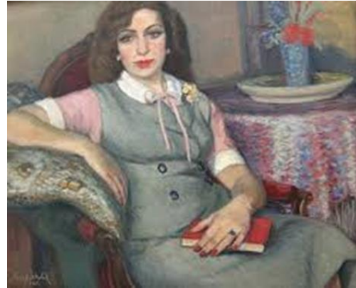
Resim 5. Şeref Akdik, Kırmızı Kitaplı Kadın, 1951, Tuval Üzerine Yağlıboya, 65x81 cm., T.C. Kültür ve Turizm Bakanlığı İzmir Devlet Resim ve Heykel Müzesi Kataloğu, 2020: 45).