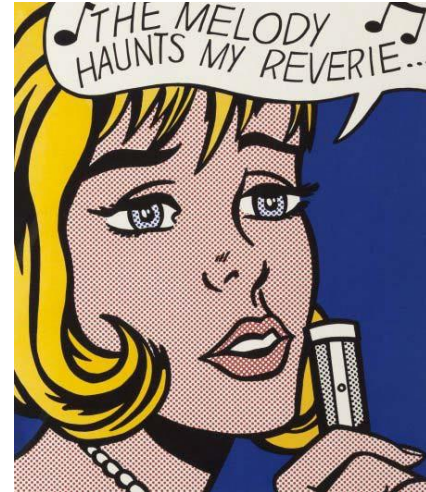
Resim 5. Roy Lichtenstein, Reverie, Serigrafi Baskı, 1965 (Bağlantı 5, 2020)

Rauschenberg de Warhol gibi eserlerinde farklı teknikler ve her çeşit materyali kullanarak deneysel çalışmalar yapmıştır. Kompozisyona dahil ettiği nesnelere ne kadar sıradan olursa olsun, sanatçı onları yine de belli bir düzene göre yan yana getirerek, belirli bir estetik görünüm vermiştir. Öylece yapılandırılmış, kendiliğinden oluşmuş gibi görünse de özünde belirli bir kompozisyon endişesiyle, sanatsal kaygılarla bir araya getirilmiş çalışmalardır (Yılmaz, 2006:184). Rauschenberg'in çalışmalarını da karmaşık öğelerin bir araya gelerek harmanlandığı, klasik kompozisyon değerlerini yok sayan bir sanat anlayışı söz konusudur.