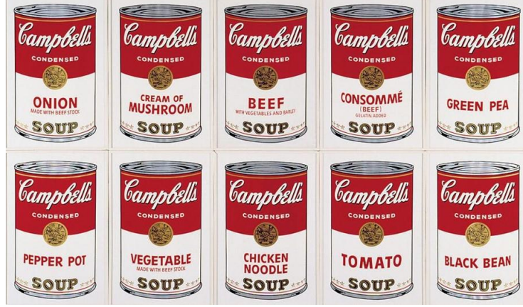
Resim 3. Andy Warhol, Campbell's Soup I, Serigrafi Baskı,1968 (Bağlantı 3, 2020)

Campbell'in Çorba Konserveleri eseri en basitleştirilmiş anlatımla, tüketim toplumunun yeni pop kültüründeki yerini ifade etmektedir. Aynı zamanda seri üretime dönüştürülen bir biçim ve etiketin hayatımıza yansımaları ele almaktadır. Warhol'un gündelik hayatında her gün aynı şeyi tekrar tekrar yediğini söylemesi, bu tekrarlama duygusunu kendince içselleştirip tüketim kültüründe bir meta haline dönüştürerek bunu eserleriyle somutlaştırmıştır (Yücel, 2019).