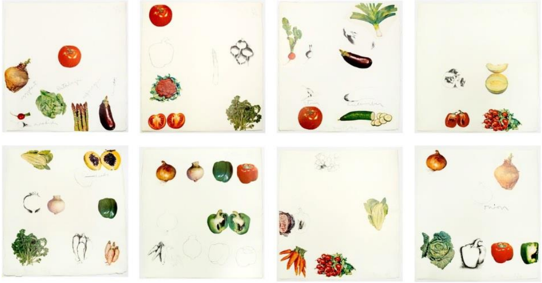
Resim 7. Jim Dine, Vegetables, Kolaj ve Litografik Baskı, 1969 Bağlantı (7, 2020)

Dine, 1969 tarihli sekiz parçadan oluşan "Sebzeler" serisinde domates, soğan, marul, havuç ve patlıcan gibi sebzelerin fotoğraflık görüntülerinden oluşmaktadır. Sebzelerin yanına, onların tanımlamasını belirten yazılar varken, bazılarında isimlerini alternatif kelimelerle tanımlamıştır. Bir soğanın yanındaki "patlıcan" gibi. Dine, kelime ve anlam arasındaki keyfi ilişkiyi abartarak yansıtmıştır (Dackerman,2015). Pop Art akımı ile benzeşen tekrarlama ve devamında aşırı kullanılan kelime ve görsellerin tüketilip değersizleştirilmesi ön plandadır. Nitekim konularını açıkça ve anında tanımlanabilecek şekilde sunmuştur. Nesnelerin kimlikleri belirlendikten sonra doğaçlama yapmakta ve onları adım adım dilediği gibi özgürleştirmiştir. Dine'nin bir seri resimlerinde kullandığı alet figürlerini kendisi ile özdeşleşmiştir ve bir söyleyişinde: "Bunun herhangi bir konu kadar iyi bir konu olduğunu düşündüm ve ailemle birlikte araçlarla büyüdüm. Onları her zaman arzu nesnelere olarak ilişkilendirdim" (Coldwell,2017). Sanatçının serigrafi tekniği ile oluşturduğu bir çok eseri mevcuttur. Kullandığı imgelerin tekrarı, parlak renkleri ve net çizgisel tarzı ile Andy Warhol'a benzetilmektedir. Andy Warhol ile farklılaşan yönü ise eserindeki nesnelere ile bir bağ kurarak aile ilişkileri veya çocukluk dönemi ile ilişkilendirmesidir. Pop Art'ın popüler olanla ilgilendiği yerde Dine, tarihiyle bağlantı kurarak daha derin anlam düzeyleri ifade ederek kontrast bir anlatım dili oluşturmuştur.