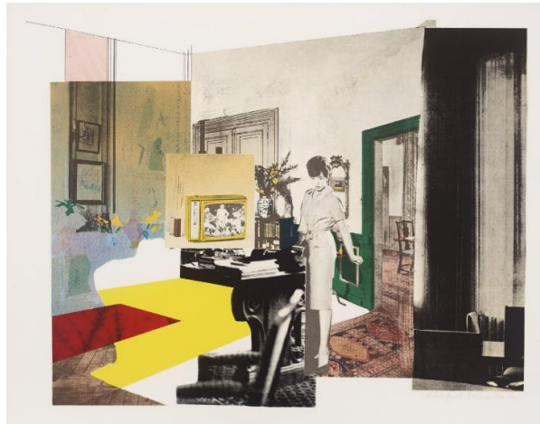
Resim 8. Richard Hamilton, Interior, Serigrafi Baskı, 1964-5 (Bağlantı 8, 2020)

Dine, 1969 tarihli sekiz parçadan oluşan "Sebzeler" serisinde domates, soğan, marul, havuç ve patlıcan gibi sebzelerin fotoğraflık görüntülerinden oluşmaktadır. Sebzelerin yanına, onların tanımlamasını belirten yazılar varken, bazılarında isimlerini alternatif kelimelerle tanımlamıştır. Bir soğanın yanındaki "patlıcan" gibi. Dine, kelime ve anlam arasındaki keyfi ilişkiyi abartarak yansıtmıştır (Dackerman,2015). Pop Art akımı ile benzeşen tekrarlama ve devamında aşırı kullanılan kelime ve görsellerin tüketilip değersizleştirilmesi ön plandadır. Nitekim konularını açıkça ve anında tanımlanabilecek şekilde sunmuştur. Nesnelerin kimlikleri belirlendikten sonra doğaçlama yapmakta ve onları adım adım dilediği gibi özgürleştirmiştir. Dine'nin bir seri resimlerinde kullandığı alet figürlerini kendisi ile özdeşleşmiştir ve bir söyleyişinde: "Bunun herhangi bir konu kadar iyi bir konu olduğunu düşündüm ve ailemle birlikte araçlarla büyüdüm. Onları her zaman arzu nesnelere olarak ilişkilendirdim" (Coldwell,2017). Sanatçının serigrafi tekniği ile oluşturduğu bir çok eseri mevcuttur. Kullandığı imgelerin tekrarı, parlak renkleri ve net çizgisel tarzı ile Andy Warhol'a benzetilmektedir. Andy Warhol ile farklılaşan yönü ise eserindeki nesnelere ile bir bağ kurarak aile ilişkileri veya çocukluk dönemi ile ilişkilendirmesidir. Pop Art'ın popüler olanla ilgilendiği yerde Dine, tarihiyle bağlantı kurarak daha derin anlam düzeyleri ifade ederek kontrast bir anlatım dili oluşturmuştur.