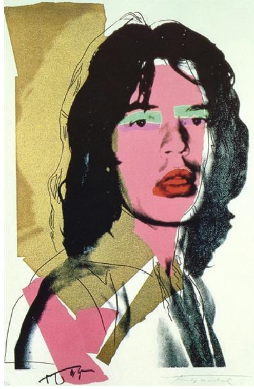
Resim 2. Andy Warhol, Mick Jagger, Serigrafi Baskı, 1975 (Bağlantı 2, 2020)

Warhol, resimlerinde kapitalist çağın gerçeklerini yansıtmaya çalışmıştır. Amerikan kitle kültürüne ait bu klişeleşmiş imgeleri, isimleri, yıldızları ve markaları serigrafi baskılarında kullanmıştır. Seçtiği temalar arasında, Elvis Presley, Marilyn Monroe, Elizabeth Taylor gibi ünlülerin yanı sıra kamuoyunun tanıdığı Jackie Kennedy, Nelson Rockefeller gibi isimlerde bulunur. Elektrikli sandalyeler, suçlular, , gangster cenazeleri, intihar ve otomobil kazaları gibi korku içeren konuların yanı sıra inekler, çiçekler gibi zararsız konuları da kullanmıştır. Warhol, kitlelerin yarattığı bu imgelerin tuval üzerinde tekrarlanması ve renklendirilmesiyle ilgi çekici sonuçlar elde etmeyi başarmıştır. Duruma göre değişen bu imgeler olduklarından daha basit, daha çekici veya daha korkunç bir görüntüyle izleyicinin karşısına çıkmıştır (Yasak, 2004).