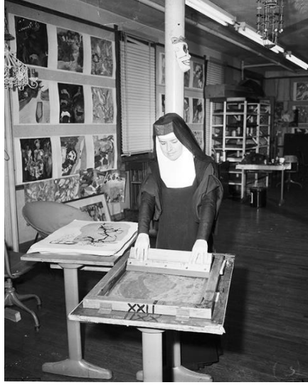
Resim 6. Rahibe Corita Kent, Serigrafi Baskı yaparken, 1957. (Bağlantı 6,2020)

1936'dan 1968'e kadar Corita Kent bir tarikatta rahibe, eğitimci ve yöneticiydi. Modern rahibe olarak değerlendirilen Kent, popülizme ve sosyal bilince dair mesajlarını geniş çapta erişilebilir olmasını sağlayan serigrafi baskı tekniğini kullanarak daha iyi bir dünyayı amaçlamıştır. Çalışmalarının çoğu kutsal ve seküler olanı yan yana getirmiştir. "Dini sanat" yapmayı amaçlayan Rahibe Corita, etrafındakiler gibi itici olmaktan kaçınmıştır. Baskılarında kullandığı dini sözler yenilik olarak karşılanmıştır ve ses getirmiştir. 1960'ların başında Corita, parlak renkler, basit formlar, basit sözler kullanarak ve modern popüler kültürü açıkça kucaklayarak Katolik Pop Art'ın ön saflarında yer almıştır. Serigrafilerinde sık sık reklam sloganları ve billboard motiflerini kullanarak, modern kültürün çoğu zaman gizli kalmış güzelliğini göstermeye çalışmıştır. Corita kentsel çevrenin en çirkin kısımlarını bile sevimli hale dönüştürmeyi amaçlamıştır (Burns,2001,69). 1965'te pop sanatına karşı tavrı sorulduğunda Kent şu cevabı vermiştir: "Reklam sistemini kendi oyununda yenme fikrindeyim. Pop sanatçıları güzel görünen simgeleri kullanıyor ve onları başka bir şeye dönüştürüyorlar. Benim görüşüm, aptal gerçekçiliğe, aptal materyalizme, dini değerlerle karşı çıkmaktır" (Dackerman,2015). Serigrafi baskı tekniği ile kendisinin ve döneminin gerçekliğini çarpıcı bir şekilde ifade eden sanatçı tüm dünyada ses getiren önemli sanatçılardan biri olmuştur.