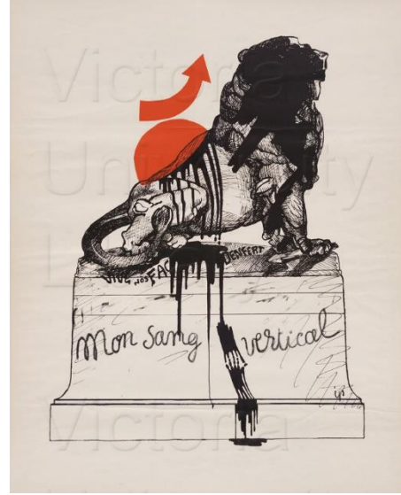
Resim 10. Vive nos FAC Denfert : Mon sang vertical, Serigrafi Baskı, 62 x 50 cm. 1968 (Bağlantı10, 2020)

1968 yılında Fransa'da öğrencilerin aşırı tüketime, kapitalizme, geleneksel kurumlara ve değerlere isyan etmesiyle başlayan Atelier Populaire, çok sayıda işçinin greve gitmesiyle birlikte sokaklarda çatışmalar meydana gelmiştir (Considine, 2015). Posterlerin çoğunun grafik analizi yapıldığında etkili görüntü ile kısa metinler arasında güçlü bir tutarlılık olduğunu göstermektedir. Basitleştirilmiş çizimler, harfler ve renkler tek tiptir. Afişlerin temel amacı, kullanılan mizah ve çok sert eleştiriler ile güçlü bir izlenim vermektir (Fatta, 2020,5).