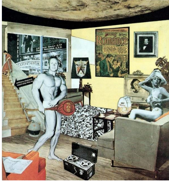
Resim 1. Richard Hamilton "Bugünün evlerini bu denli cazip kılan nedir?" Kolaj, (41,9 x 29,8 cm) 1956 (Bağlantı 1, 2020)

Pop Art'ın başlangıcı 1956 yılında "İşte Yarın" isimli bir sergiye dayanmaktadır. Kitle imgelerinin bolca kullanıldığı bu sergide Richard Hamilton'ın "Günümüzün Evlerini Bu Kadar Farklı, Bu Kadar Çekici Kılan Nedir?" başlıklı kolaj eseri ve İngiltereli eleştirmen Lawrence Alloway'ın bir makalesinde "Pop Art" söyleminden bahsetmesiyle ortaya çıkmıştır.