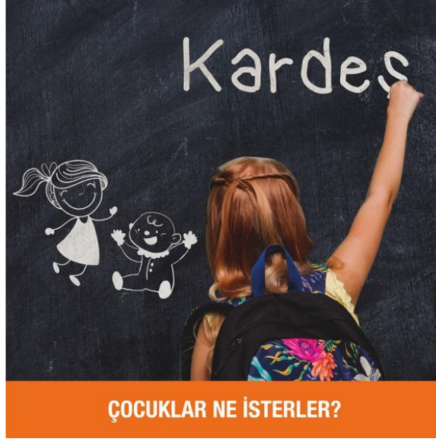
Resim. 3 Kardeş

Sosyal medya reklamlarının dördüncüsünü oluşturan bu çalışma, hayali "kardeş" olan bir çocuğu belirtmektedir. Tasarımın sağında yer alan kız çocuğu tahtanın sol kısmına abla-kardeş figürü çizmiştir. Ayrıca tahtaya hayalinin kardeş olduğunu yazmıştır. Slogan diğer tasarımlarda olduğu gibi çalışmanın altında dikdörtgen zemin üzerine yerleştirilmiştir. Her tasarımda dikdörtgen alan farklı ve çarpıcı renklere boyanmıştır.