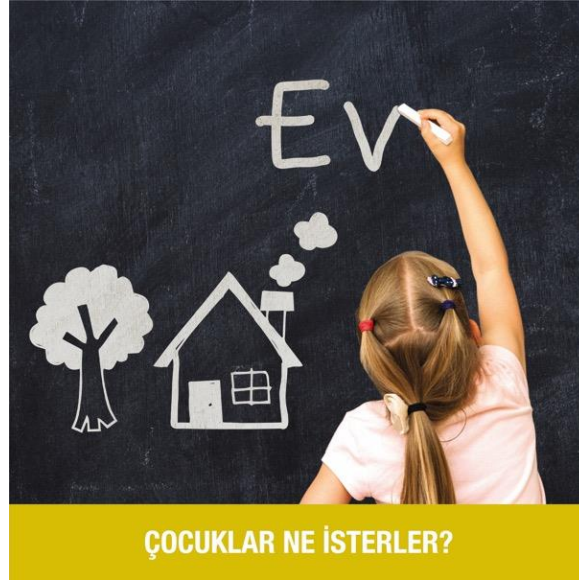
Resim. 4 Ev

Sosyal medya reklamlarının dördüncüsünü oluşturan bu çalışma, hayali "kardeş" olan bir çocuğu belirtmektedir. Tasarımın sağında yer alan kız çocuğu tahtanın sol kısmına abla-kardeş figürü çizmiştir. Ayrıca tahtaya hayalinin kardeş olduğunu yazmıştır. Slogan diğer tasarımlarda olduğu gibi çalışmanın altında dikdörtgen zemin üzerine yerleştirilmiştir. Her tasarımda dikdörtgen alan farklı ve çarpıcı renklere boyanmıştır.