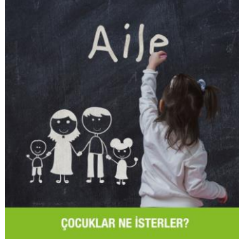
Resim 1. Aile

yorum ve beğenileri artırmak gibi amaçlarının dışında hedef kitleyle etkileşimde bulunma arzuları da vardır. Bulduğumuz zaman içerisinde sosyal medya reklamları aracılığıyla hedef kitleye ulaşmak mümkündür. Bu reklamlarda görülen en önemli özellik, reklamların tıklanması sonucu marka ile hedef kitle arasında etkileşimin gerçekleşmiş olmasıdır. Hedef kitlenin reklama beğeni ve yorum gibi geri bildirimlerde bulunması olumlu bir süreçtir (Uğurlu, 2018: 205-206). Sosyal medya reklamlarının geniş kitlelere ulaşma imkanı göz önünde bulundurularak korunmaya muhtaç kimsesiz çocukların hayallerini bireylere ulaştırmak ve bu doğrultuda onları bilinçlendirmek amacıyla beş sosyal medya reklamı tasarlandı. Bu tasarımlar aşağıda görüldüğü gibidir: