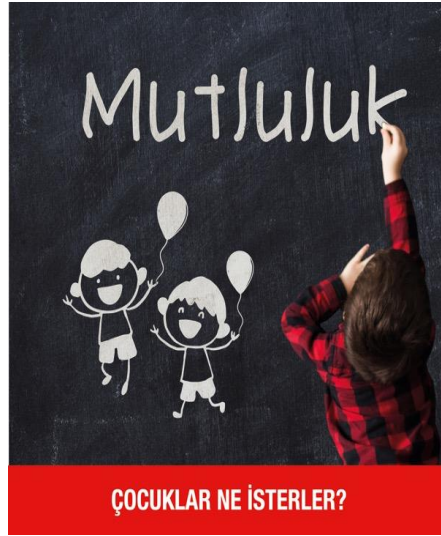
Resim 2. Mutluluk

Her çocuk aile ortamında bulunmayı, anne ve baba sevgisiyle büyümeyi ister. Bu konuda hazırlanan sosyal medya reklamında okul döneminde olan bir çocuğun aile hayalini tahtaya resmettiği görülmektedir. Anne, baba ve iki çocuktan oluşan aile resminin üst kısmında el yazısıyla "aile" kelimesi yer alıyor. Çocuk fotoğrafı, aile çizimi ve aile tipografisi kara tahtaya ortalı olacak şekilde yerleştirilmiştir. Tasarımın alt kısmında yeşil dikdörtgen alan üzerine "Çocuklar ne isterler?" sloganı serifsiz font ve büyük yazı karakterleri ile yazılmıştır.