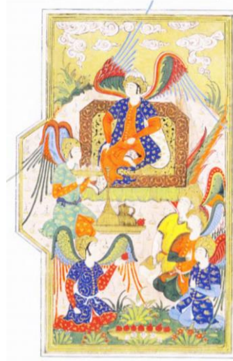
Resim 3: Dervişlerin Toplantısı, Bihzad İbrahimi İmzalı, 1581 tarihli (Çağman ve Tanındı, 1979: 123).