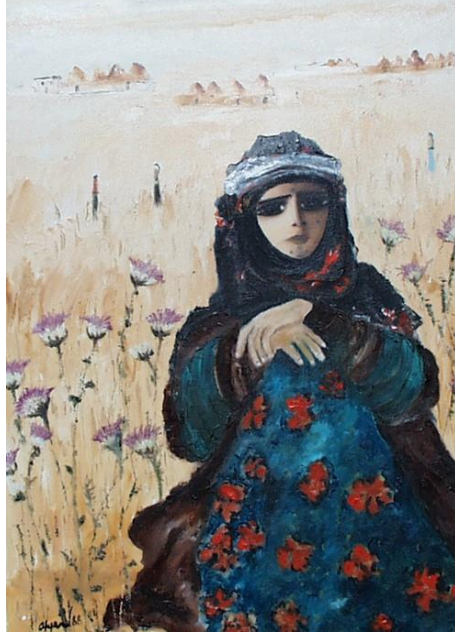
Resim 7: Fikret Otyam, Tarladaki Kız, 1988 ("Sanal", 2019)

Fikret Otyam'a ait Tarladaki Kız (Resim 7) isimli eserde, uzakta kerpiçten evlerin bulunduğu uçsuz bucaksız çorak bir arazi içerisinde, yaban çiçekleri arasında bir kadın figürü görülmektedir. Resmin ön planında yer alan kadın figürü, tıpkı Nuri İyem' in resimlerinde olduğu gibi iri gözlü ve gözlerini hiç kırpmadan direk izleyicinin gözlerinin içine bakmakta ve zorlu coğrafi koşullarda açan yaban çiçekleri gibi kuvvetli Anadolu kadını temsil etmektedir. Elini dizinin üzerinde bağlayarak oturmuş hali kendinden emin, bilge ve üretken kadını yansıtmaktadır. Sanatçının Anadolu kadını, geleneksel değerleri ve yaşam koşulları içerisinde toplumcu ve gerçekçi bir anlayışla resmettiği görülmektedir. Figürün giymiş olduğu mavi renkli elbise üzerinde yer alan nar çiçeği deseni de kadının doğurganlığını, üretkenliğini ve bereketini temsil etmektedir.