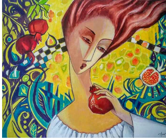
Resim 9: Aynur Mahmudova Kaplan, Kadın ve Nar, T.Ü.Y.B., 45 x 60 cm, 2018, Özel Koleksiyon ("Sanal", 2019)

kırmızı renkteki narların hiperrealist bir anlayışla çarpıcı bir şekilde yansıtıldığı görülmektedir.