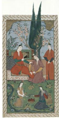
Resim 2: Kadınlar Arasında Eğlenti, Minyatür, 1. Ahmed Albümü ("Sanal", 2019).

Kadınlar Arasında Eğlenti (Resim 2) isimli minyatürde, açık alan bahçe içerisinde tahtta oturan ve sultan olduğu düşünülen bir kadın figür ile ona hizmet eden, ayakta yanında bekleyen ve ön kısımda oturan diğer kadın figürleri görülmektedir. Bahçe tasvirine bakıldığında geri planda servi ağaçları, çiçek açmış bahar dalları, ön planda ise akan küçük bir çay ve çiçeklerin açtığı yeşil bir alan resmedilmiştir. En ön plana bakıldığında da kırlar üzerine oturmuş karşılıklı sohbet eden ve birbirine ikramda bulunan iki kadının ortasında içinde üç adet taç kısımları yukarı gelecek şekilde narların bulunduğu tabak, dikkati çekmektedir. İslam'da kutsal cennet meyvelerinden biri olarak görülen, bolluk ve bereketin sembolü olan narın sarayda ikram edilen önemli bir meyve olduğu anlaşılmaktadır.