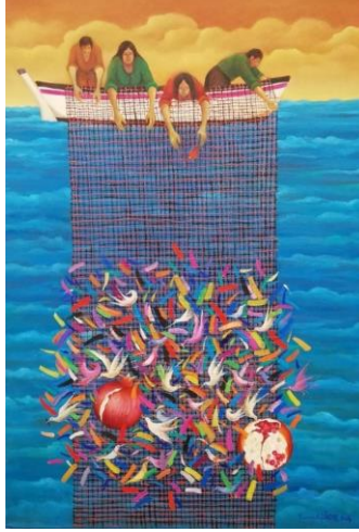
Resim 6: Emin Güler, İsimsiz, T.Ü.Y.B., 100 x 70 cm, 2017 ("Sanal", 2019).

Şeker Ahmet Paşa, Çağdaş Türk resim sanatının temelini atan ve döneminde gerek resim tekniğiyle gerekse ele almış olduğu natüromort, peyzaj gibi farklı konu zenginliğiyle adından söz ettirmiş önemli ressamlarımızdan biri olarak bilinmektedir. Şeker Ahmet Paşa'nın, Narlar ve Ayvalar (Resim 5) isimli natüromort resminde masanın üzerinde bir kısmı sepetin içerisinde, bir kısmı ise sepetin dışında olmak üzere dalından koparılmış narlar ve ayvalar görülmektedir. Resmin üçgen kompozisyon anlayışıyla oluşturulduğu ve renklerin belli bir düzen içerisinde çaprazlama olarak yerleştirildiği dikkati çekmektedir. Sanatçının eserindeki renk zenginliği ile doğadaki gerçekliği yansıtmaya başarılı bir şekilde bir araya gelince lirik bir anlatım gözler önüne serilmektedir.