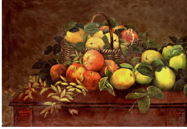
Resim 5: Şeker Ahmet Paşa, Narlar ve Ayvalar, T.Ü.Y.B., 1906 ("Sanal", 2019).

Şeker Ahmet Paşa, Çağdaş Türk resim sanatının temelini atan ve döneminde gerek resim tekniğiyle gerekse ele almış olduğu natüromort, peyzaj gibi farklı konu zenginliğiyle adından söz ettirmiş önemli ressamlarımızdan biri olarak bilinmektedir. Şeker Ahmet Paşa'nın, Narlar ve Ayvalar (Resim 5) isimli natüromort resminde masanın üzerinde bir kısmı sepetin içerisinde, bir kısmı ise sepetin dışında olmak üzere dalından koparılmış narlar ve ayvalar görülmektedir. Resmin üçgen kompozisyon anlayışıyla oluşturulduğu ve renklerin belli bir düzen içerisinde çaprazlama olarak yerleştirildiği dikkati çekmektedir. Sanatçının eserindeki renk zenginliği ile doğadaki gerçekliği yansıtmaya başarılı bir şekilde bir araya gelince lirik bir anlatım gözler önüne serilmektedir.