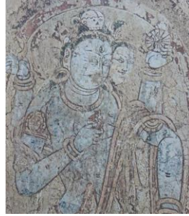
Resim 1: Uygur Duvar Resmi. Elinde Nar Tutan Bir Budist Tanrısı (Çağlıtütüncügil, 2013: 69).

Nar imgesinin sanat alanındaki kullanımına bakıldığında, ilk örneğe Uygur dönemine ait bir duvar resminde rastlanmaktadır. VII-VIII. yüzyıllardan kaldığı düşünülen bu resim Orta Asya'da, Balavaste'de bulunmuştur (Resim 1) (Aktaran: Çağlıtütüncügil, 2013: 68).