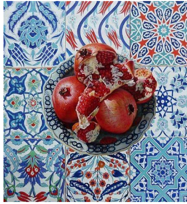
Resim 8: İsmail Acar, Nar, T.Ü.K.T., 75 x 75 cm ("Sanal", 2019)

Fikret Otyam'a ait Tarladaki Kız (Resim 7) isimli eserde, uzakta kerpiçten evlerin bulunduğu uçsuz bucaksız çorak bir arazi içerisinde, yaban çiçekleri arasında bir kadın figürü görülmektedir. Resmin ön planında yer alan kadın figürü, tıpkı Nuri İyem' in resimlerinde olduğu gibi iri gözlü ve gözlerini hiç kırpmadan direk izleyicinin gözlerinin içine bakmakta ve zorlu coğrafi koşullarda açan yaban çiçekleri gibi kuvvetli Anadolu kadını temsil etmektedir. Elini dizinin üzerinde bağlayarak oturmuş hali kendinden emin, bilge ve üretken kadını yansıtmaktadır. Sanatçının Anadolu kadını, geleneksel değerleri ve yaşam koşulları içerisinde toplumcu ve gerçekçi bir anlayışla resmettiği görülmektedir. Figürün giymiş olduğu mavi renkli elbise üzerinde yer alan nar çiçeği deseni de kadının doğurganlığını, üretkenliğini ve bereketini temsil etmektedir.