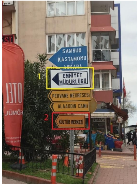
Görsel 11. Sinop Şehir Merkezi "Emniyet Müdürlüğü" ve "Kültür Merkezi" Yönlendirme Tasarımı