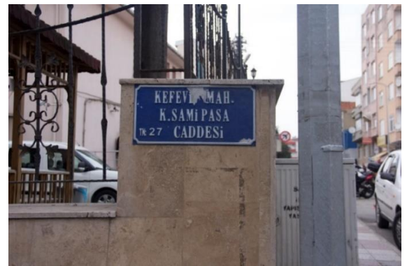
Görsel 2. Sinop Şehir Merkezi "Cadde" Yönlendirme Tasarımı