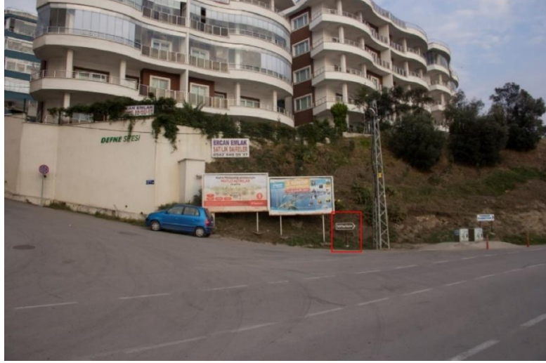
Görsel 14. Sinop Şehir Merkezi "Paşa Tabyaları" (Uzak Görüntü) Yönlendirme Tasarımı