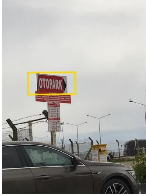
Görsel 24. Sinop Şehir Merkezi "Otopark" Yönlendirme ve İşaretleme Tasarımı