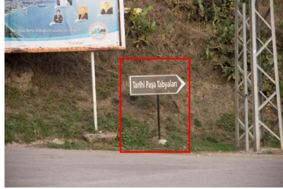
Görsel 15. Sinop Şehir Merkezi "Paşa Tabyaları" (Yakın Görüntü) Yönlendirme Tasarımı