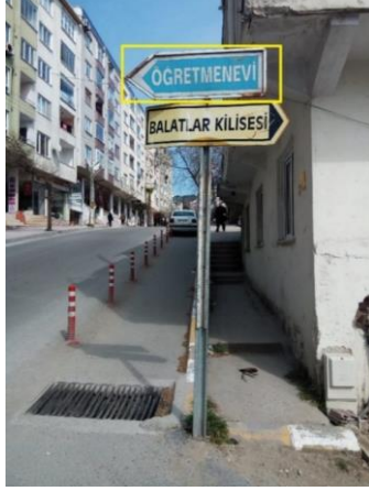
Kaynak: Asım Topaklı, 2019