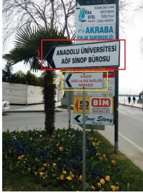
Görsel 10. Sinop Şehir Merkezi "Anadolu Üniversitesi AÖF Sinop Bürosu" ve "Ağız ve Diş Sağlığı Merkezi" Yönlendirme Tasarımı

Sinop Şehir merkezindeki Resmi Kurum Yönlendirme tasarımlarına bakıldığında her bir tasarımın farklı bir görsel düzenlemeyle oluşturulduğu görülmektedir. Tasarımlar da kullanılan font, simge, sembol ve renk gibi öğeler gelişmiş güzel rasgele kullanılmıştır. Tabelalar da kullanılan malzeme araştırmacı tarafından incelenmiş ve farklı malzemelerin kullanıldığı saptanmıştır. Ayrıca tabelaların işlevselliğini etkileyen önemli etkenlerden olan "konumlandırma" aşağıdaki görsellerden de anlaşılacağı üzere birçok tabela ile birlikte kullanılmış ve bu tasarımların algılanabilirliğini oldukça düşürmüştür.