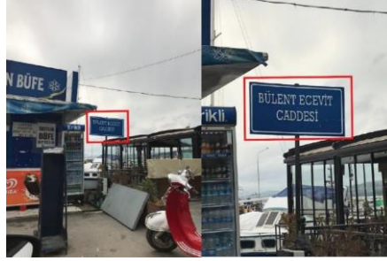
Görsel 6. Sinop Şehir Merkezi "Cadde" Yönlendirme Tasarımı (Uzak ve Yakın Görünüş)