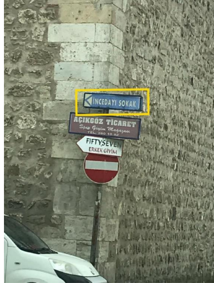
Görsel 7. Sinop Şehir Merkezi "İncedayı Sokak" Yönlendirme Tasarımı