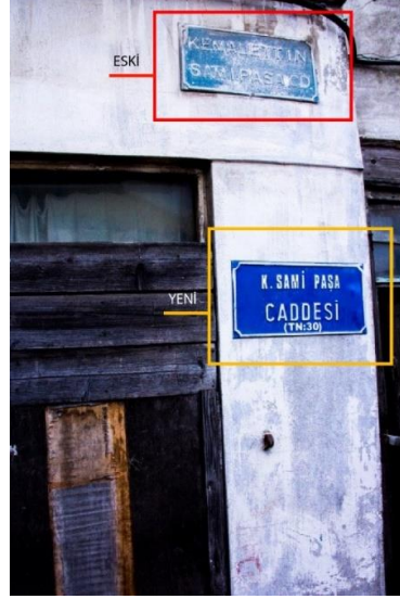
Görsel 5. Sinop Şehir Merkezi "Cadde" Yönlendirme Tasarımı