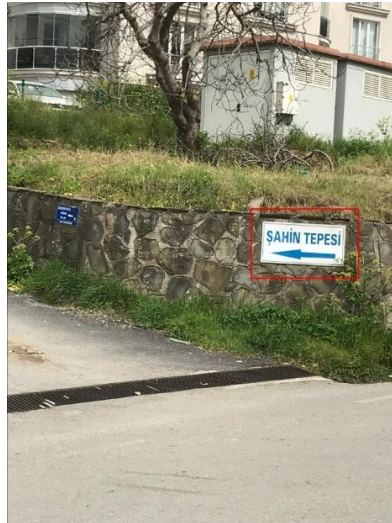
Görsel 25. Sinop Şehir Merkezi "Şahin Tepesi" Yönlendirme ve İşaretleme Tasarımı

Sinop şehir içi "Sosyal Alan" yönlendirme tasarımlarında da incelenen diğer tüm tasarımlarda olduğu gibi tasarım bütünlüğünden söz etmek imkânsızdır. Renk, boyut, simge, sembol ve font açısından her bir tasarımda değişiklik görülmektedir. Ayrıca yönlendirmelerin devamında varılan yeri gösteren işaretleme tasarımlarına rastlanmamıştır. Bu durum sosyal alanlarda bir tasarım dizgesinin oluşturulmadığını ortaya koymaktadır. Bu alanlar yerli ve yabancı turistler tarafından oldukça ziyaret edilen yerlerdir. Bu kapsamda bu tasarımların aynı tasarım dilini konuşması diğer tüm tasarımlarda olduğu gibi oldukça önemlidir.