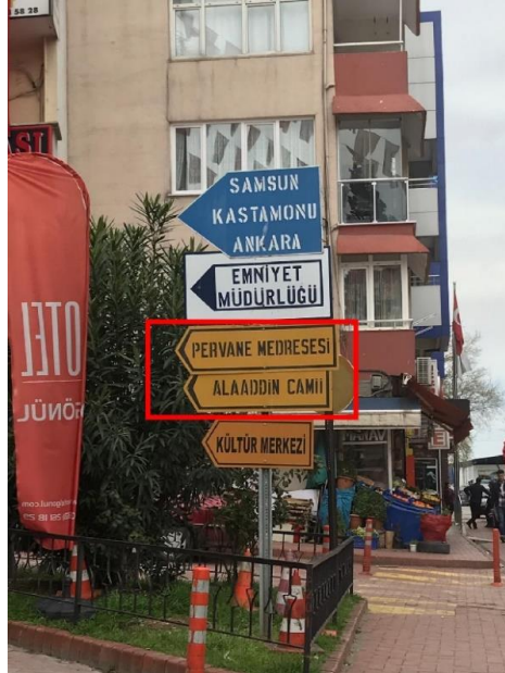
Görsel 16. Sinop Şehir Merkezi "Pervane Medresesi" ve "Alaaddin Camii" Yönlendirme Tasarımı