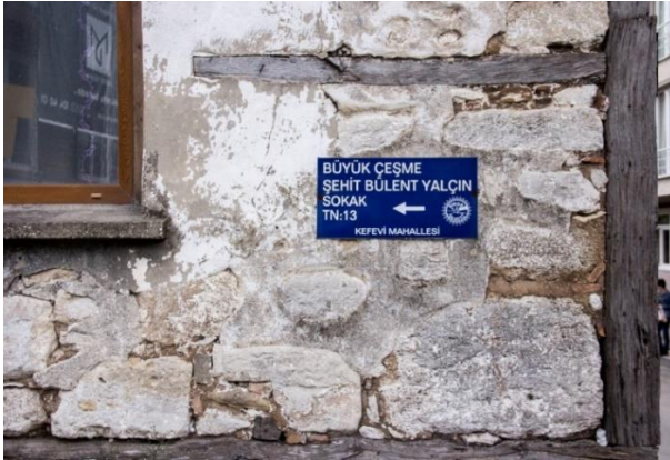
Görsel 1. Sinop Şehir Merkezi "Sokak" Yönlendirme Tasarımı

Görsel-1 ve Görsel-2'deki tabela tasarımları incelendiğinde, yazı karakterlerin farklılığı, farklı simge ve semboller kullanımı ilk bakışta dikkati çeken ve tasarım bütünlüğünü bozan unsurlardır. Bunun yanı sıra kullanılan malzeme açısından da birbirinden farklıdırlar. Görsel-1'de kullanılan malzeme alüminyum üzeri folyo kaplamayken Görsel-2'deki kabartma metal plaka üzeri boyamadır.