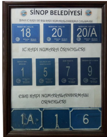
Kaynak: Sinop Belediyesi Arşivi, fotoğraf: Asım Topaklı, 2019