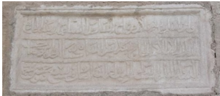
Resim 2 Hacıbeyler Câmii doğu tarafında bulunan kitabe

Hacıbeyler Câmii'nin yapım tarihini ile ilgili olarak, yapının üzerinde iki kitabe bulunmakta olup doğu tarafındaki üç satırlık sülüs kitabesine göre, yapının ilk inşa tarihi olan 757 H. 1356 M. yazılıdır. Kitabe Cin Suresi, 18. Ayetle başlamaktadır.