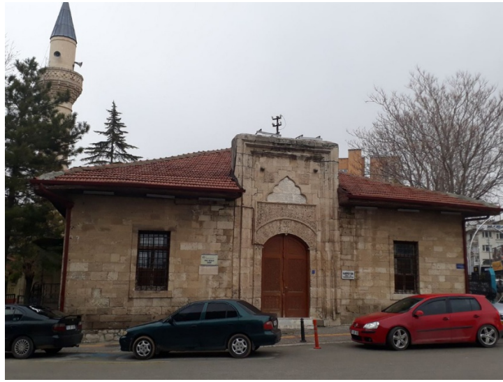
Resim 3 Hacibeyler Câmii Genel Görünüm (Göçmen 2018)

Yapıda kullanılan malzeme bugünkü haliyle dışta, tümüyle kesme taş içte destekler ve üzerindeki kemerler de kesme taş olup iç duvarı sıvalı olduğundan malzemesi bilinmemektedir. Yapının üst örtüsü düz dam şeklinde olup son onarımda kiremit kırma çatı ile örtülmüştür(Dülgerler, 2006:35)..