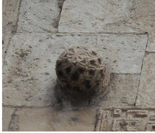
Resim 8 Kapının üzerinde bulunan kabara

Kitabe ile giriş kapısı arasında yer alan bölümde genel olarak rûmî ve hataî grubu motiflerinden oluşan bir desen yer aldığı tezyinata sahiptir.