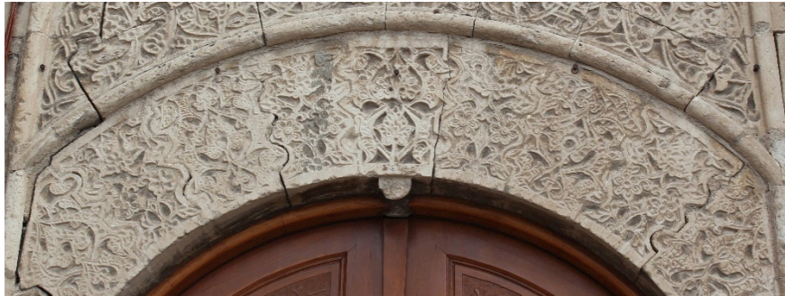
Resim 12 Geçmeli kemer detay