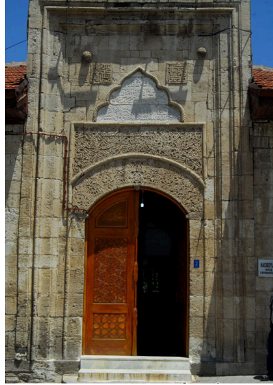
Resim 13 Soldaki fotoğraf Arapzâde Câmii Taçkapısı, sağdaki ise Hacıbeyler Câmii Taçkapısı (Diez, 1950)

Dikbasan Câmii ile de benzerlikleri bulunan Hacıbeyler Câmii'nin mihraplarında benzerlikler göze çarpar. Bugün her iki câmii'nin de orijinal mihrapları olmasa da kaynaklar bu benzerliği bilmemizi sağlamaktadır. Genel olarak Hacıbeyler Câmii günümüze tümüyle orijinal haliyle gelememiş olsa da mimari özellikleri ve taçkapı tezyinatı bakımından incelendiğinde Karamanoğulları Beyliğinin sanat özelliklerini taşıdığını görmekteyiz. Bu gibi kıymetli yapıların daha özenli bir şekilde korunarak gelecek nesillere olduğu gibi aktarmak hedefimiz olmalıdır.