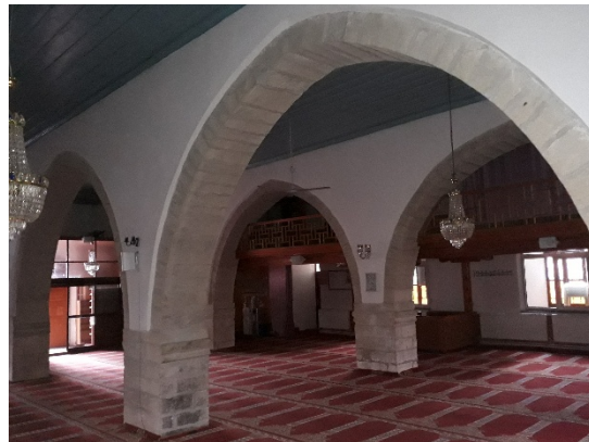
Resim 4 Hacibeyler Câmii İçinden Genel Görünüm (Göçmen 2018)