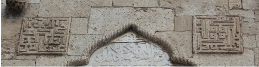
Resim 7 Hacıbeyler Câmii kûfi hat ile oluşturulmuş kare çerçeveleri

Kitâbenin üst kısmında sağda ve solda kûfi hat ile işlenmiş kabartma kare çerçeveler yer almaktadır. Kufi yazılı panolar Zengi, Eyyubi ve Memluklu dönemlerinde inşa edilen yapıların bezemelerinde yaygın olarak kullanılmıştır. Sağdaki dört defa tekrarlanmış biçimde “Muhammed” yazılıdır. Soldaki ise dört halifenin isimleri sırasıyla yazılıdır.