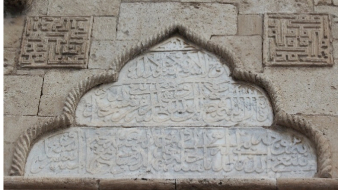
Resim 6 Hacıbeyler Câmii Kitabesi

“ Allah. Ondan başkası yoktur. Ancak O’na ibâdet ederiz. Ümmî olan Peygamber –salât-ü selâm üzerine olsun- buyurdu ki: Kim Allah için bir mescid yaptırırsa o; Allah’ın rızasını kazanmıştır. Allah ona cennette onun gibi bir mescid yapar. Sâhibi bu hadise uyararak bu câmiyi yaptırdı. Tarihi 902 dir”(Konyalı, 1967:294).