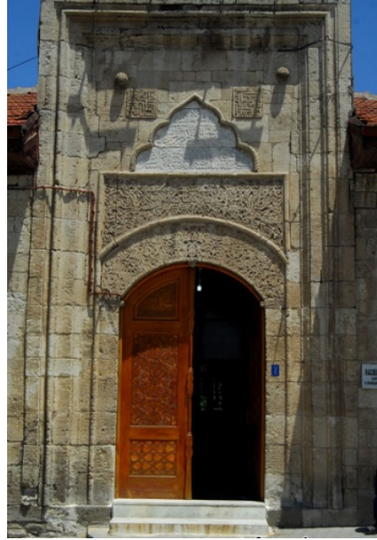
Resim 5 Taçkapıdan Genel Bir Görünüm (Cambaz 2011)

Hacıbeyler Câmii'nin taçkapısı teziniatlı olan tek yeridir. Dıştan içe doğru ayrıntılı bir şekilde incelersek taçkapının süsleme şeridinde herhangi bir teziniat bulunmamaktadır. Altılı dendan ile çevrili olan taçkapı kitabesi burmalı bir silme ile çerçeveselendirilmiştir. Beyaz mermere sülüs hattı ile 4 satır halinde şu kitâbe kabartma olarak işlenmiştir: