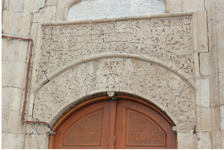
Resim 9 Taçkapı tezyinatından bir detay

Kitabe ile giriş kapısı arasında yer alan bölümde genel olarak rûmî ve hataî grubu motiflerinden oluşan bir desen yer aldığı tezyinata sahiptir.