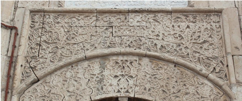
Resim 10 \frac{1}{2} simetrik rumî deseninden detay

Kitabenin hemen altında yer alan kısımda rûmî motiflerinden oluşan \frac{1}{2} simetrik bir desen oyma tekniği ile nakşedilmiştir. Rûmilerin iç bünyeleri olması sebebiyle desen zengin bir görüntüye sahip olmuştur.