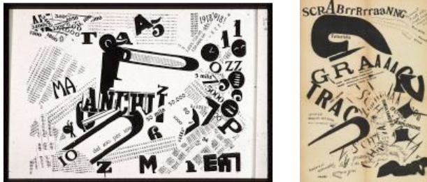
Resim 5,6 - Filippo Tommaso Marinetti, “Les Mots et Liberte Futuristes” - (Bağlantı 5)

19. yüzyılın sonları ve 20. yüzyılın başlarında, “ Art and Crafts “ ve “ Art Nouveau “ hareketleri yazı karakterlerinin ortaya çıkmasında önemli bir yere sahiptir. Ancak, yazının sanat ve tasarımda kullanılacağı dönem Avangard sanat hareketleridir. Seri üretimde tasarım, harf tasarımları, minimalizm, işlevsellik, asimetrik sayfa düzeni gibi unsurların bulunması yazının kullanım boyutunu değiştirmiştir. Ayrıca bu dönemde şairlerde kullandıkları sözcüklerde görsel algı öğesini ön planda tutarak düzenlemeler yapmışlardır. Böylelikle tipografik anlatım diline katkı sağlanmaya başlanmıştır. 20. yüzyılın başlarında Fransa’daki Kübizm hareketi yeni sorgulamalar ile değişim yaratmış, aynı zamanda birçok sanat hareketine de öncülük etmiştir. Kübizm ile birlikte plastik bir anlatım dili olarak sanatın içinde görülen yazı, Fütürizm ile birlikte artık bir imge değil kavram olarak kendini göstermektedir. Yazın hareketiyle başlayan Fütürizm zaman içerisinde görsel sanatlarda da etkisini göstermeye başlamıştır. Marinetti ve arkadaşları, dilbilgisi kurallarını hiçe sayarak, tipografik bir devrim çağrısında bulunmuşlardır. Sayfa üzerinde geleneksel yöntemler dışında; atlamalar, kalın yazılar, italik yazılar, büyük/küçük boyutlu yazılar stilin oluşmasına etken olmuştur. (Bağlantı 5)