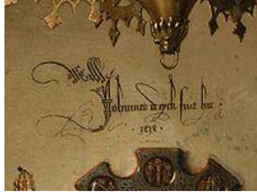
Resim 3,4(ayrıntı) - Jean Van Eyck "Arnolfini' nin Evlenmesi ", (Bağlantı 3 ve 4)

Resim tarihinde önemli bir yere sahip olan "Arnolfini'nin Evlenmesi", Batı sanatının özgün ve karmaşık tablolarından biri olarak kabul edilirdi. Tek yaratıcının tanrı olduğuna inanılan Orta Çağ Kilisesinde sanatçısının yapıtına imza atması hoş karşılanmamaktaydı. Aynanın üzerindeki imzada "Jan Van Eyck Buradaydı" yazısı, yapıtın 1434 yılında yapılmış olması, Tanrı ögesini umursamadan kendi imzasını yapıtın orta yerine atması, Eyck'ın bir devrim yarattığı söylemini de beraberinde getirmiştir (Bağlantı 3 ve 4).