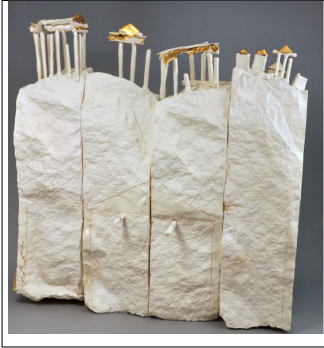
Resim 2: İrfan Aydın, “Troy”, 2012

Sanatçının malzemeyi kullanım biçimi, Apollon Smintheion kutsal alanı ile kurduğu bağı yansıtmaktadır. Kazı alanında karşımıza çıkan beyaz mermer yapılar, sanatçının beyaz porselen malzeme seçiminin tesadüf olmadığını belli etmektedir. Bu seçim, malzemedeki ustalığı ile tapınağı sıklıkla betimleyen sanatçının çalışmalarında, kazı alanı ile görsel bir çağrışım sağlamaktadır. Aydın'ın çalışmalarındaki beyaz porselen sütunlar, şehrin eski renkli günlerinden çok uzakta olan bugünkü antik kent görüntüsüne gönderme yapmaktadır.