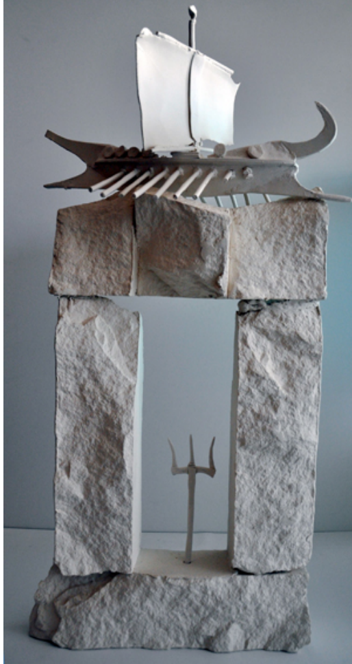
Resim 3: İrfan Aydın, “Poseidon’un Laneti”, 2010

virtüzlüğüdür. Apollon Smintheus tapınağını kendine kaynak olarak seçmemiştir. Adeta tapınakta anlatılan efsanelerin içinde kendine bir yer bulmuştur. Kullandığı malzeme ile de meydan okuyan bir tavrı vardır. Porselen yüksek derecede sinterleşen hassas bir malzemedir. Porselen ile bu kadar ince, uzun parçalar üretmek ve pişirmek neredeyse imkânsızdır. (Kırca, 2016: 206)