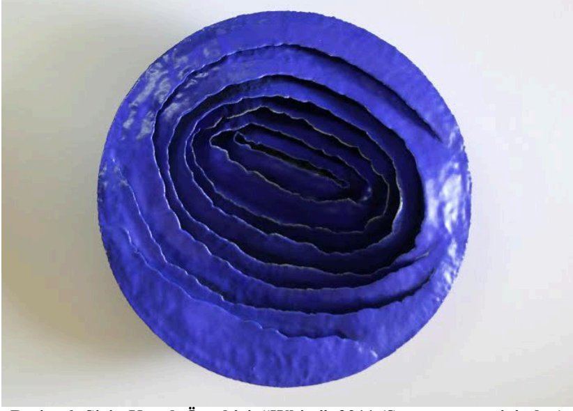
Resim 6: Şirin Koçak Özeskici, “White”, 2011

Sanatçı bu serisinde zaman zaman, parmak izlerinin belirginliğini kaybetmeyeceği renkli sırları da çalışmalarında kullanmıştır. Böylece, çalışmaların üretilmesindeki düşünce biçimi zamansız olsa da, renkler sanatçının kendi zamanına ve dönemlerine dair ipuçları taşımaktadır.