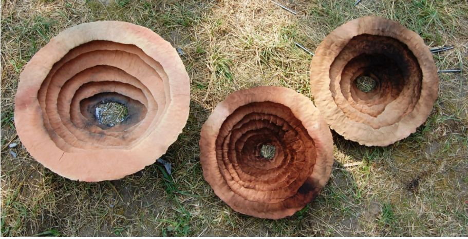
Resim 5: Şirin Koçak Özeskici, sanatçının Romanya’da “Human” Uluslararası Sempozyumu’nda ürettiği çalışmalar, 2010

Feyza Özgündoğdu’nun, eski bir seramik parça üzerindeki parmak izlerine ve bu izlerin taşıdığı olası mesaja dair görüşleri de dikkat çekicidir: