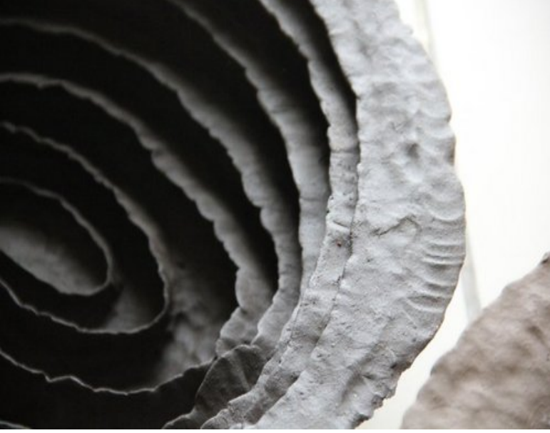
Resim 4: Şirin Koçak Özskici, “Inner Space Series I”, 2010 (Sanatçının arşivinden)

Şirin Koçak Özskici, bir arkeolojik buluntu üzerindeki parmak izinden yola çıkarak kurguladığı çalışmalarında, sanata dair çok eski bir tartışmaya kendini dahil etmektedir. Eski bir seramik ustasının 'bu seramik kabı yapan kişi benim' deme yolu olarak parmak izini kabın üzerine bırakması, sanatçı tarafından bir var olma biçimi olarak kabul görmüştür. Sanatçının kendi var oluşu da, tıpkı eski seramik ustasınınki gibi, kendi izini parçanın üzerine bırakarak olmuştur. Araya giren yüzlerce yılın ardından sanatçı, bu fikri sürdürmek istemiştir. Özskici, kendi el izlerini seramiklerin üzerine bırakarak, bu yoldan gitmekte ve bu düşüncelyi seramiklerine taşımaktadır.