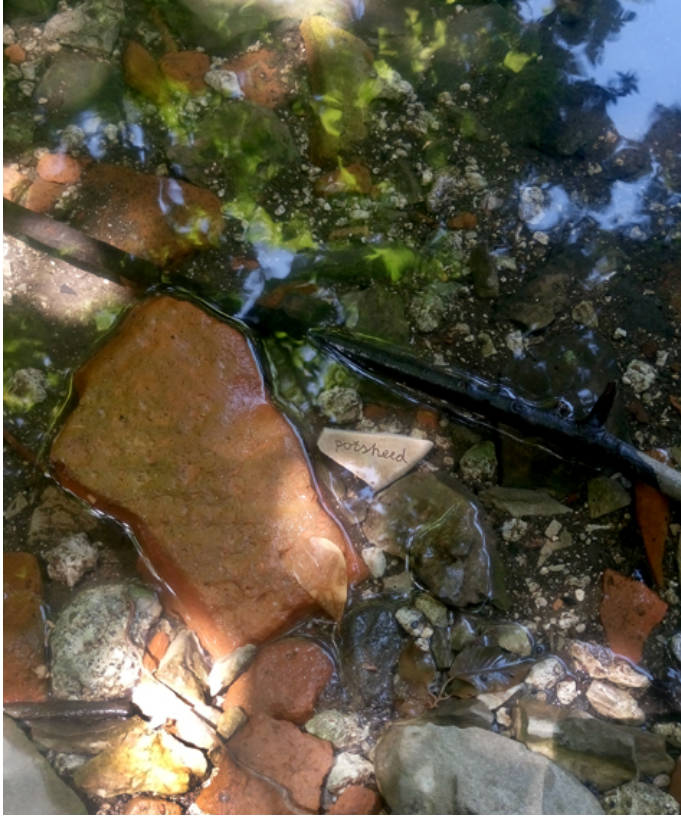
Resim 9: Ayşe Balyemez, VI. Uluslararası Sanat Sempozyumu'nda Olympos'ta üretilmiş "Potsherd" serisine ait fotoğraf, 2018

2018 yılında Olympos'ta gerçekleştirilen VI. Uluslararası Sanat Sempozyumunda Balyemez, kişisel çalışmalarında bu kırıkların izini sürmeye devam etmiştir. Kendi yarattığı seramik kırıklarını antik şehrin özgün kırıkları ile bir arada fotoğraflamış, iki farklı zamana ait kültürel izin aynı karede yer almasını kurgulamıştır. Seramik kırıkları üzerine kazınmış olarak görülen potsherd kelimesi, antik şehri gezerken kırıklar arasında kendine rastlayan kişi için, ait olduğu zamana ve neden orada olduğuna dair bir ipucu vermektedir.