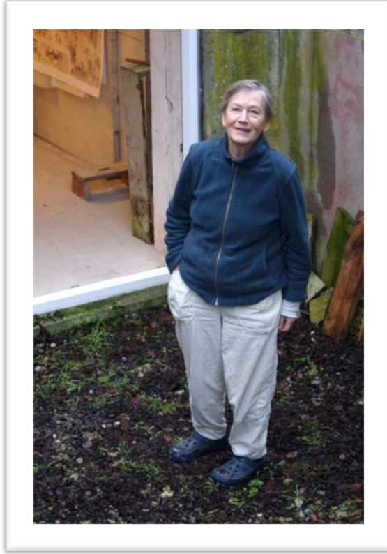
Görsel 1. Nina Hole

yükselerek oluştuğu ve çok büyük olduğu için kendiliğinden mekana aitlik kavramı ile buluşmaktadır. Dolayısıyla belki de geleneksel seramik anlayışının bir parçası olmayan bu özellik, Nina Hole tarafından kendiliğinden seramiğe atfedilmiştir. Ateşin başında o sırada yapıldığı için performans özelliği taşıması ile birlikte kavramsal olarak sorguladığı sanatsal mefhumlar çağdaş seramik sanatı için yeni alanlar yaratmıştır diyebiliriz.