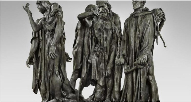
Resim 5. Auguste Rodin, Calais Burjuvaları

Rodin düşünen adam adlı heykelinde bu umutsuzluğun insanı nasıl bir ruh dünyasına sürüklediğini çok iyi yansıtır. Dünyaya atılmışlığın verdiği acı tüm iliklerine kadar işlenmiş durumdadır. Belki yaşam kendisine hiçbir şey sunmamıştır. Her şey sanal bir dünyada gerçekleşmektedir. Bu sanal dünyada kendini var etme çabası başarısızlıkla sonuçlanır. Bu başarısızlık, tekrar eden gelgitler içinde sürekli çatışmalardan kaynaklanır. Bu çatışmalar ise tüm enerjisini almıştır. Bir tükenmişlik yaşanmaktadır.