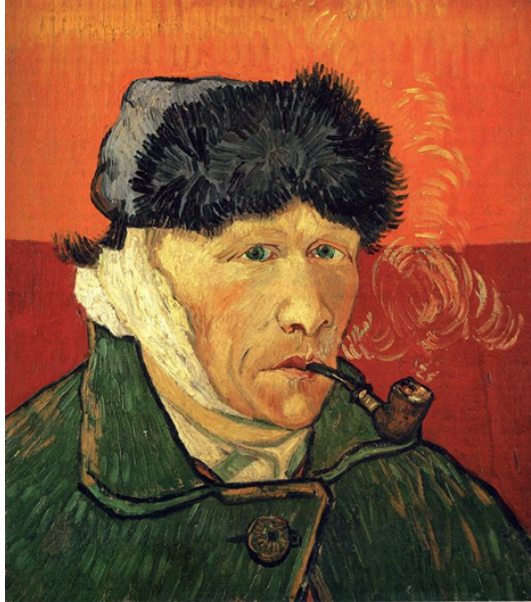
Tablo 2. Vincent van Gogh, “Kulağı Sarılı Özportre”, 1889.

Doğayı yeniden inşa ilkesini yaşama geçiren ilk ressamlardan biri Vincent van Gogh'tur. Van Gogh, tutkulu anlatımıyla içselliği ile soyutlama ve doğayı yeniden inşa anlayışını başarılı bir biçimde resimlerinde yansıtmıştır. Van Gogh, konularını çevresinden alıyordu: manzaraları, tek tek insanları, ev içlerini. Renkleri ve biçimsel özellikleri daha da belirginleştiren Van Gogh, konularını kişisel ve dinsel parıltılı bir gözle değerlendiriyordu. Boya kullanımını kalın tabakalar halindeydi. Çoğu zaman uzun çizgisel fırça darbelerinden yararlanıyordu. Sanatçının tutkulu ve deliliğe varan coşkuları yapıtlarını ayrı bir etki gücü kazandırıyor (Lynton, 2009: 20 – 21). Bu bağlamda Vincent van Gogh'un doğayı kendi içselliği ve coşkuları bağlamında yapıtlarında yeniden oluşturduğu ifade edilebilir.