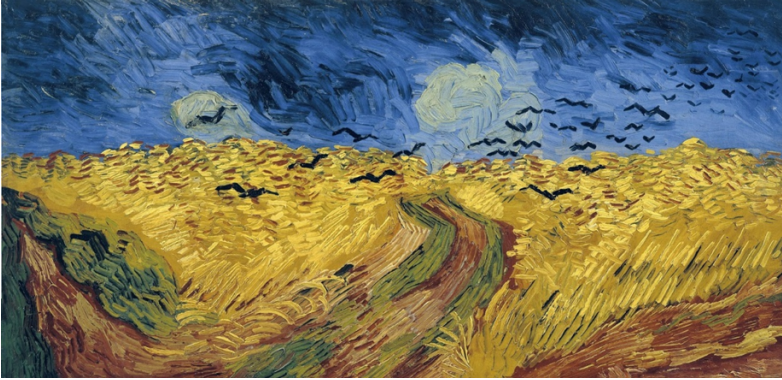
Tablo 3. Vincent van Gogh, “Buğday Tarlası ve Kargalar”, 1890.

Kesilen alanın alt bölümü kiremit rengi, üst bölümü ise turuncudur. Yeşil gözlü figürün kulağının beyaz bir bezle sarıldığı görülmektedir. Figürün kalpağı Prusya mavisi ve grimsi tonlar içermekte, giydiği parka ise yeşil tonlardadır. Resimde yer alan kahverengi ağırlıklı pipo duman yaymaktadır. Tuvaldeki kompozisyon yassı bir espasa sahiptir. Resimde gözlerinde hüzün olan figür Vincent van Gogh'un kendisidir. Tuvaldeki figürün kulağının sarılı olarak betimlenmesi de ressamın kulağını kestikten kısa bir zaman sonra bu resmi yaptığını göstermektedir. Kırmızı ve turuncu zemin önünde duran ressamın giydiği parkanın üstten düğmeyle sıkıca iliklenmiş olması; ressamın buhranlı yaşamındaki korunma gereksinimini simgelemektedir. Ressamın yer yer uzun çizgi biçiminde vurduğu renkler onun dışavurumlarını ve coşkularını yansıtmaya yardım etmektedir. Resimde asıl olarak acılarla ve buhranlarla dolu bir dünyada savunma yolları arayan ve her şeye rağmen yaşamına devam eden bir kişi betimlenmektedir. Resimde kendisini betimleyen ressam yaşam ile olan savaşımını göstermeye çalışmaktadır.