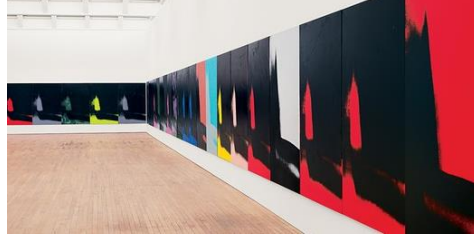
Görsel 7: Andy Warhol, Gölgeler Sergisi, 1979, New York.

( https://gagosian.com/news/museum-exhibitions/2018/10/26/andy-warhol-shadows/ , 2020)