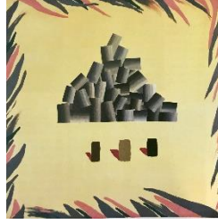
Görsel 8: David Hockney, Daha Az Gerçekçi Bir Natürmort, 1965.

Andy Warhol gibi Pop Sanat akımının üyelerinden olan David Hockney de gündelik hayatın unsurlarına resimlerinde yer vermiştir. David Hockney de gölgelere olan ilgisini şu şekilde anlatmıştır: “Ben oldum olası gölgelere dikkat ederim. Çünkü çocukluğumun geçtiği Bradford’da pek fazla gölge yoktu. Paris’teki en eski Musee d’ Art modern de Julio Gonzales salonundaki kübist heykellerin gölgelerinin fotoğrafını çekerdim” (Hockney, Gayford, 2016: 56). Hockney gölgeleri kullanarak, Daha Az Gerçekçi Bir Natürmort resmini yapmıştır. Bu resimde geometrik biçimler ve gölgeleri yer almaktadır ve gölgenin yanıltıcı özelliğinden yararlanılmıştır. Resimde gerçek geometrik biçimler ile resimdeki geometrik biçimlerin gölgeleri birbirinden ayırt edilememektedir. Hockney’in resminde gölgeler sayesinde yanılsama oluşturulmaktadır. Resmin kenarlarında bulunan gölgemsi şekiller de bu yanılsamayı arttırmaktadır. Platon’un mağara metaforunda da gölgelerin yanıltıcı özelliği kullanılmaktadır. Gölgelerin insanları yanıltma özelliğinde de anlatıldığı üzere bazen kocaman bir kaplan olarak algıladığımız bir gölge gerçeğinde minicik bir kedi olabilmektedir. Mağaradaki tutsaklar da duvarda gördükleri gölgeleri gerçek olarak algılamışlardır. Gölgeler mağaradaki tutsakları yanıltmıştır, tıpkı David Hockney’in natürmort resmindeki gölgeler ve gerçekliğin karışması gibi denebilmektedir (Görsel 8).