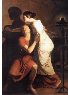
Görsel 2: Joseph Benoit Suvée, Çizim Sanatının İcadı, 1791

İlkçağ insanların gölgeyi kullanarak oluşturduğu resim yapma tekniği, sanat tarihinin ilerleyen dönemlerinde Joseph Benoit Suvée (1743 - 1807) ile kullanılmaya devam edilmiştir. Joseph Benoit Suvée (1743 - 1807), resminde konu olarak duvara yansıyan gölgeden yapılan resimleri ele almıştır. Roma'da geçen bir hikâyeden ilham alarak resim yapan Joseph Benoit Suvée, resminde bir erkeğin gölgesini duvara çizen bir kadın resmetmiştir. Etkilendiği hikâyede de sevgilisi çok uzaklara gidecek olan bir kızın sevgilisinin yüzünü unutmamak ve sevgilisi hep yanında hissetmek için gölgesini duvara resmettiği anlatılmaktadır (Kris ve Kurz 2013: 82). Bu hikâyede gölgelerin yanıltıcı özelliği söz konusudur denebilmektedir. Neoklasizm öncülerinden olana Benoit Suvée, resminde de duvara yansıyan gölgeleri çizerek silüetler oluşturmuştur. Joseph Benoit Suvée yapmış olduğu resmi ile gölgelerin kullanılarak çizimler yapılabileceğini kanıtlamaktadır. Yapmış olduğu bu resmine "Resim Sanatının İcadı" ismini koyarak da bunu netleştirmektedir denebilir (Görsel 2).