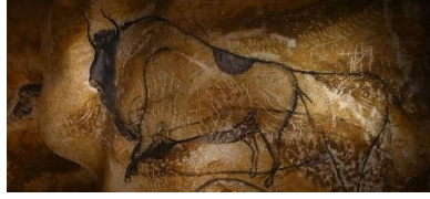
Görsel 1: Mağara Duvar Resmi, Gölge ve Kontur Çizimi

İlkçağ insanları gölgelere çok farklı anlamlar yüklemişlerdir. Çoğu zaman gölgeleri de kişiselleştirmişlerdir. Gölgelerin ışık yansımalarına göre uzayıp kısılması durumu veya kalınlaşıp ince bir hale dönüşmesi durumu ilk insanlar için gölgeyi ruh ile eşleştirme nedeni olmuştur. Yabani insan için gölgesi, bedeninin canlı parçasıdır, gölgesiyle ilgili bir işlemin doğrudan bedeniyle bağıntılı olduğuna inanmaktadır (Ergüven, 2000: 148). Gölgeyi bu kadar önemli gören İlkçağ insanları gölgeleri anlamlandırmaya çalışmışlardır. Gölgenin kendilerinin bir parçası ve ruhları olduğuna inandıkları için de onu sabitleştirmek istemişlerdir. Bu doğrultuda gölgeler ilk insanlar içinde yanıltıcı olmuştur denebilmektedir. O dönemki insanlar gölgelerin gerçekliğine ve büyüne kendilerini inandırarak mağara duvarlarına düşen gölgelerinin kenarlarından çizerek kendi portrelerini ve silüetlerini de sabitlemeye çalışmışlardır. Sadece kendi gölgelerini değil hayvanların ve birbirlerinin gölgelerinin kontur çizgilerini de çizerek birçok canlıyı ve cansız nesnelere sabitlemişlerdir. Bu şekilde onların kalıcı olmalarını sağladıklarına inanmışlardır. Duvara silüetlerini çizdikleri canlıları kalıcı kılamasalar da yapmış oldukları çizimlerin günümüze kadar yaşamalarını ve kalıcı bir belge olmasını sağlamışlardır (Görsel 1).