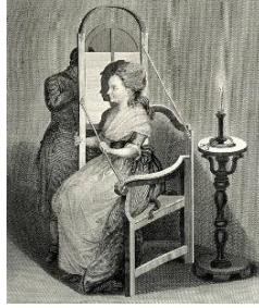
Görsel 3: Gölgeler Kullanılarak Silüet Çizmek İçin Kullanılan Makine, Gravür, 1972

oluşan gölge manikanın düzlemine düşmektedir. Silüet makinasının arakasında bulunan sanatçı gölgelerden faydalanarak modelin portresini kolaylıkla çizmekte ve resmetmektedir. Bazı sanatçılar bu çizimleri keserek kalıplar hazırlamakta ve başka düzlemler üzerinde de aynı portre çizimini tekrar etmektedirler. 18. ve 19. yüzyıl Avrupası'nda Silüetler ucuz ve popüler bir portrecilikti (Hockney, Gayford, 2016: 65) Silüet makinası kullanılarak yapılan tüm portre resimleri silüetlerden oluşmaktaydı. Bu durum aynı zamanda bize bir kişinin net gölgesinden o insanı tanıyabileceğimizi de göstermektedir (Görsel 3).