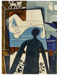
Görsel 5: Picasso.P, Gölge, 1953 ( http://www.itobiad.com/tr/download/article-file/395482 , 2020)

Picasso'nun resimlerinde gölge; görülenin anlatımı olmamıştır. Görünmeyenin, düşüncelerdeki ya da bilinçaltının yansıması gibidir. Platon'un mağara alegorisinde tutsaklar gölgeleri gerçek olarak algılamakta Picasso'nun resminde gölgelerin gerçek olanı değil hayal gücünü yansıtan bir yanı vardır. Picasso resimlerini mağara duvarına yansıyan gölgeler gibi düşünürken gerçek hayatı da gölgelerdeki gibi yansıtmaya çalışmaktadır. Resimlerinde sadece nesneyi, figürü doğayı birebir resmetmenin yanında tüm bunların görünmeyen yanlarını da gölgelerle ifade etmeye çalışmaktadır. Bu şekilde resimler de görülen nesnelerin gerçek hayatta resimde görüldükleri gibi mi olduklarını sorgulamak istemektedir. Platon da bu bağlamda; bir tapınağın sütunlarının gözden uzaklaşırken küçülerek gösterilmesi bir tür yalandır. Çünkü bu sütunların boyları aynıdır. Onun felsefesinde gerçek rakamlarla ve ölçüyle sayılır ve tartılır. Platon bunun "zihindeki akıl unsuru" diye tanımlar. Bunun tersine resimler yanlış yönlendirirler, örneğin aynadaki yansımalar veya duvardaki gölgeler. Bir gölge ya da imge şeyin kendisi değildir. Platon'a göre Natüralist ressam bir tür düzenbazdır (Hockney, Gayford, 2016: 73). Aslında Picasso'nun da resimde gölgeyi kullanırken sorgulamak istediği resim mi gerçek olan yoksa gölge mi gerçek olan sorusudur, denebilmektedir (Görsel 5).