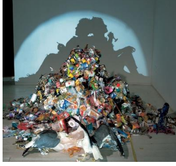
Görsel 12: Tim Noble ve Sue Webster, Kirlili ve Beyaz çöp Kovası, 1998 ( http://www.timnobleandsuewebster.com/wild_mood_swings_2009-10.html )

(M.Haydaroğlu, Çev.) İstanbul: Yapı Kredi Yayınları, 2017)