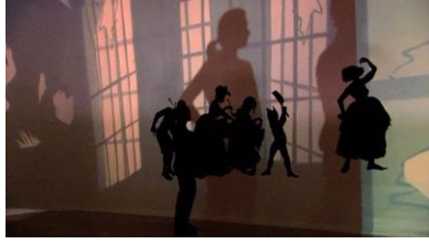
Görsel 9: Kara Walker, Sergi Tasarımı Detay, 2002

varabilmektedir. Platon'un mağara alegorisinde özgür kalan tutsak gölgelerin gerçek olmadığını mağaradan ve tutsaklıktan kurtulduğunda anlamaktaydı. Kendi gölgesini ya da kendi yansımalarını suda görünce bunun bilincine varmaktaydı. Walker'in sergilerinde de izleyici kendi gölgesini gölge algısı yaratılan kâğıt silüetler üzerinde görünce gerçek gölgenin ayırımına varabilmektedir (Görsel 9) (Görsel10).