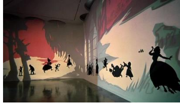
Görsel 10: Kara Walker, Sergi Tasarımı Detay, 2013

( https://art21.org/read/kara-walker-projecting-fictions-insurrection-our-tools-were-rudimentary-yet-we-pressed-on/ )