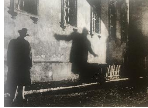
Görsel 4: Carol Reed, Üçüncü Adam, 1949

Gölgeler korku ve adrenalin hissi uyandırdıkları gibi kişileri yanıltma özelliği de barındırabilmektedir. Küçük ve sevimli bir çocuğu gölgesiyle çok büyük ve korkunç bir kişi gibi algılayabiliriz ya da gerçekten korkunç ve dev gibi bir kişi minik bir çocuk gibi görünebilir gölgesiyle. Gölgenin yanıltıcı özelliği sinemada da kullanılmaktadır. Bu tarz filmlere örnek olarak Carol Red'in Üçüncü Adam (1949) filmi verilebilir. Filmin başrol karakteri olan Harry Lime'yi canlandıran Orson Welles film çekimlerine gelemediği bir gün çekimler için başka birisine daha büyük palto giydirilerek Welles'e silüet olarak benzemesi sağlanmıştır. Daha sonra da çekimlerde Welles'in dublörünün gölgesi oynatılmıştır. Ama film izleyicileri Orson Welles'in filmde o karede oynadığını düşünürlerken onun yerine bambaşka biri rolü gölge olarak canlandırmaktadır. Verilen yarı ışık ile silüet belirsiz kılınarak gölgelerle kişiler yanıltılmıştır. Gölgeler bilgi kadar yanılsama da üretebilmektedir (Hockney, Gayford, 2016: 67) (Görsel 4).