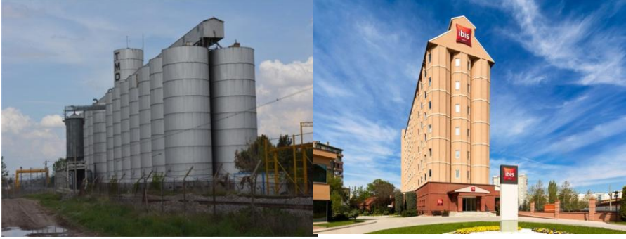
Fotoğraf -11: Eskişehir Büyükşehir Belediyesi Arşivi, İbis Otel,2016.