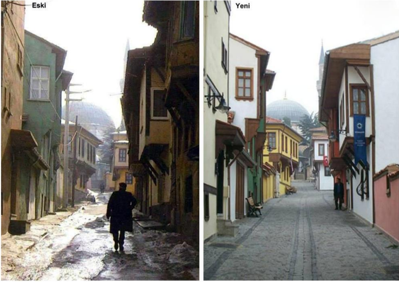
Fotoğraf -3: Odunpazarı Kentsel Sit Alanı, 2016.