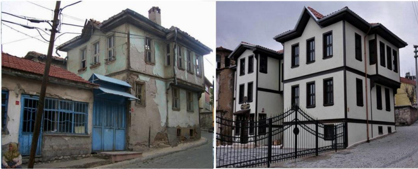
Fotoğraf -2: Odunpazarı Kentsel Sit Alanı, 2016.

UNESCO Dünya Mirası Listesi'ndede yer alan Odunpazarı "Tarihi ve Kentsel Sit" olarak koruma altına alınmıştır. Ayrıca tarihi ve kültürel mirasın dünyaya tanıtılması kapsamında "Odunpazarı Evlerini Yaşatma Projesi" önemlidir. Bu proje kapsamında 1 han, 1 külliye, 2 kervansaray, 3 camii, 15 çeşme, 30 sokakta bulunan 300 evin restorasyonu ve yapımı gerçekleştirilmiştir (Eskişehir Valiliği, 2014).