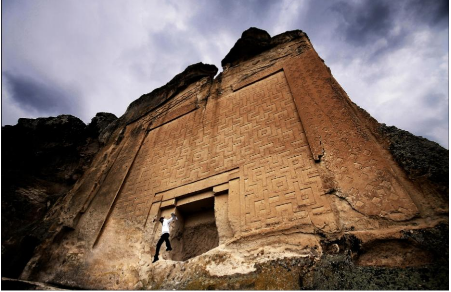
Fotoğraf -4: Midas Anıtı, 2016.

altı şehirleri bulunmaktadır . Doğal peyzaj unsurlarında bölgedeki kültürel zenginliklerdendir. (Çıracı vd., 2008: 93).