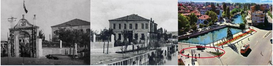
Fotoğraf -12: Eskişehir Büyükşehir Belediyesi Arşivi, Kolordu Binası,2016.