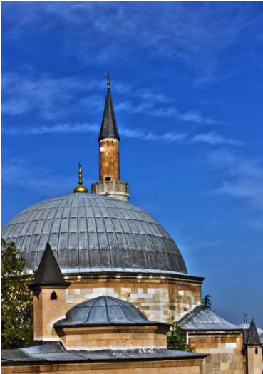
Fotoğraf -5: Eskişehir Büyükşehir Belediyesi Arşivi, Kurşunlu Külliyesi, 2016.