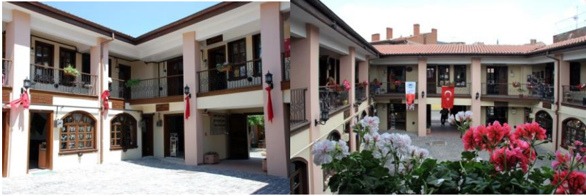
Fotoğraf -1: Atlıhan El Sanatları Çarşısı, 2016