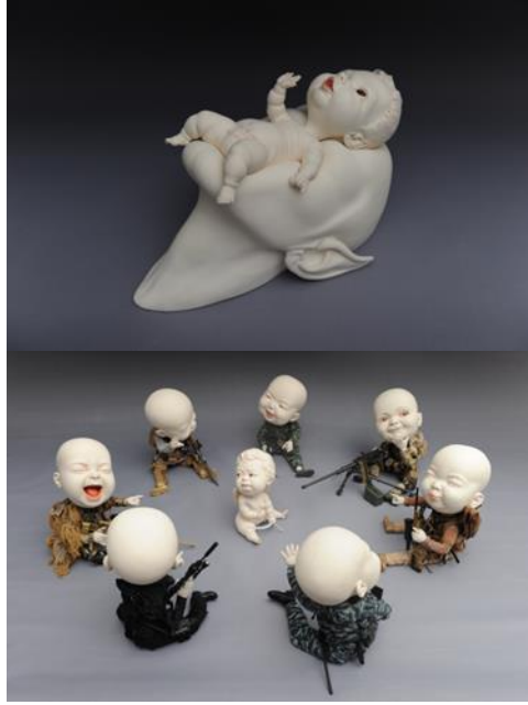
Görsel 4: 'Looking for a Star' - 'Security Summit'

ve içerik olarak daha önce yapmış olduğu eserleri ile örtüşmekte ve benzer bir dil birliği ve anlatım içerdiği başka bir ifadeyle tarz-üslup bütünlüğü içinde olduğu görülmektedir. Tıpkı sanatçının 'Looking for a Star' ve 'Security Summit' eserlerinde olduğu gibi sanatçının kendine özgü bu üsluplaşmış biçim ve anlatım dili başka bir ifadeyle gerçekliğin düşsel anlatımı göze çarpmaktadır.