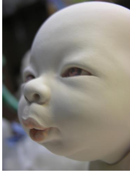
Görsel 5: Talking to Me, Detaylar, 2013, Hong Kong

( https://johnsontsang.wordpress.com/2013/07/26/talking-to-me/ )