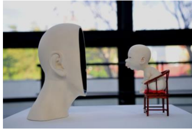
Görsel 2: Talking To Me, 2013, Hong Kong

Sanatçının 2013 yılında yapmış olduğu, sosyal bağlamda bir şeyler aktarmak ve düşündürmek isteyen “Talking To Me”-‘Konuş Benimle’ adlı eseri porselen malzeme kullanılarak, tornada ve elde modelleme teknikleri ile şekillendirilmiştir ve yaklaşık 40×20×29 cm ölçülerindedir.