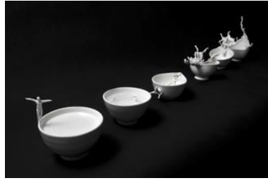
Görsel 1: Splash of Wonder ve Bowls of Fantasy, Johnson Tsang, Porselen, 2011

( https://johnsontsang.wordpress.com/2011/10/01/bowls-of-fantasy-special-prize-of-2011-yeonggi-international-ceramik-biennale-international-competition/ )