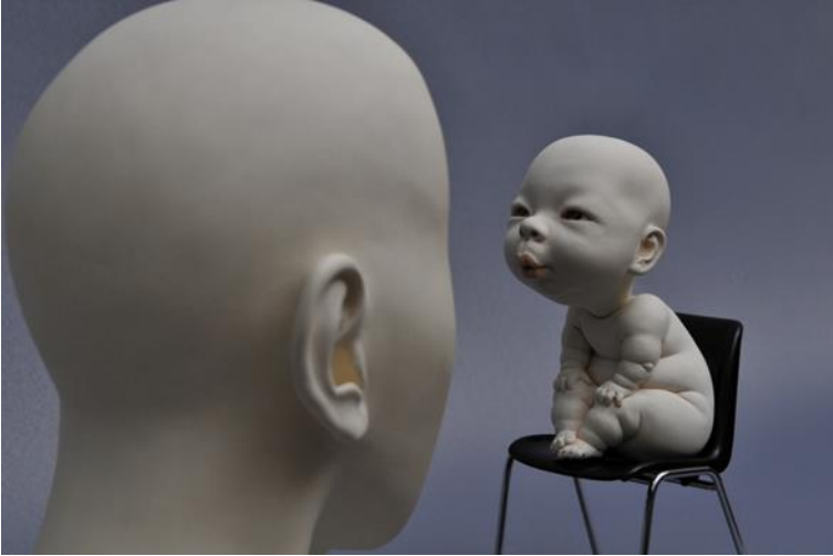
Görsel 4: Talking to Me Detaylar, 2013, Hong Kong